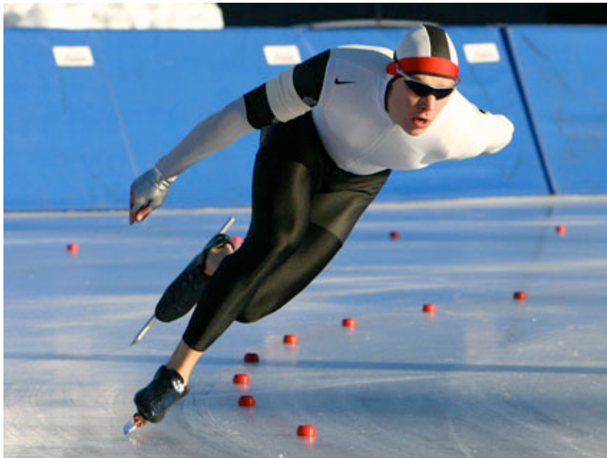
Pikaluistelija Pekka Koskela sprinttereiden SM-kisoissa 2005.

Suomen 33 vuotta kestänyt mitaliton kausi pikaluistelun arvokisahistoriassa katkesi viime talvena, kun Pekka Koskela otti suomalaisluistelijana ensimmäisen maailmancupvoiton. Tämä tapahtui 500 metrillä Harbinissa Kiinassa ja matkakohtaisissa MM-kilpailuissa Inzellissä Saksassa pronssimitalin 1 000 metrillä.